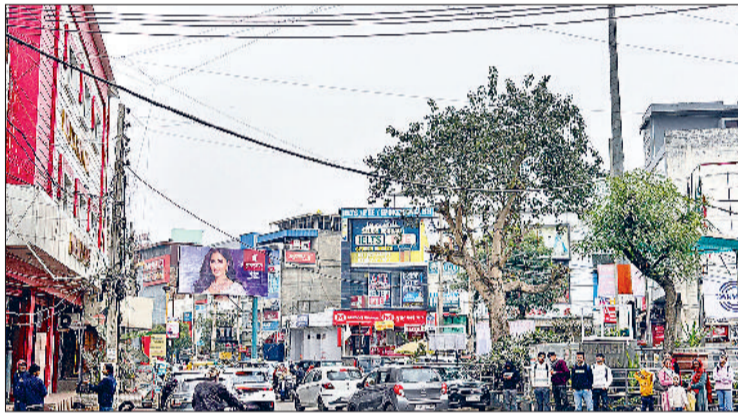
सोनीपत। सुभाष चौक का दृश्य।

मौसम विशेषज्ञों के अनुसार पश्चिमी विक्षोभ के प्रभाव और ठंडी उत्तरी हवाओं की सक्रियता के कारण क्षेत्र में तापमान लगातार उतार-चढ़ाव का सामना कर रहा है। बादलों की मौजूदगी के कारण दिन के समय धूप न निकल पाने से अधिकतम तापमान सामान्य से नीचे रहा, जबकि रात के तापमान में भी