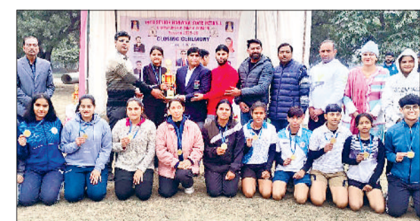
महिला और पुरुष वर्ग में विजेता रही टीम के प्रतिवादी खिलाड़ी अतिथियों के साथ।

हरियाणा स्पोर्ट्स यूनिवर्सिटी राई के मैदान पर पिछले दो दिनों से चल रहे रोमांचक खेल का समापन हुआ। 19वीं सीनियर हरियाणा स्टेट नेटबॉल चैंपियनशिप (पुरुष एवं महिला) में रोहतक की टीमों ने अच्छा प्रदर्शन करते हुए दोहरा खिताब अपने नाम किया। पुरुष वर्ग के फाइनल मुकाबले में कोर्टे की टक्कर देखने को मिली। रोहतक और पलवल की टीमों में एक-एक अंक के लिए संघर्ष करतीं नजर आईं, लेकिन अंततः रोहतक ने 19-15 के स्कोर के साथ जीत दर्ज कर