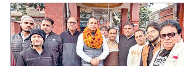
हरिभूमि न्यूज़ ▶▶ गन्नीर

■ भाजपा कार्यकर्ताओं, सामाजिक संगठनों तथा आम नागरिकों ने दी बधाई