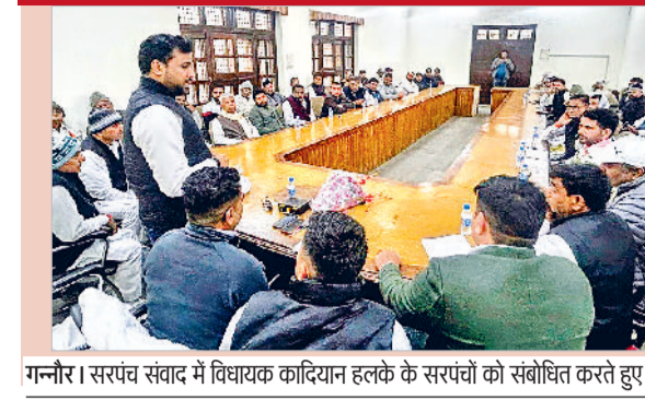
गन्नौर। सरपंच संवाद में विधायक कादियान हलके के सरपंचों को संबोधित करते हुए।