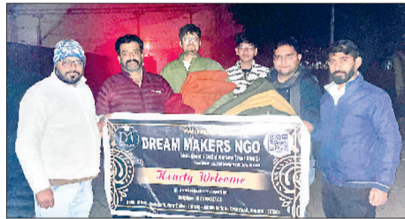
गोहाना। फुटपाथों पर साते मिले लोगों में कंबल वितरित करते एनजीओ के सदस्य।