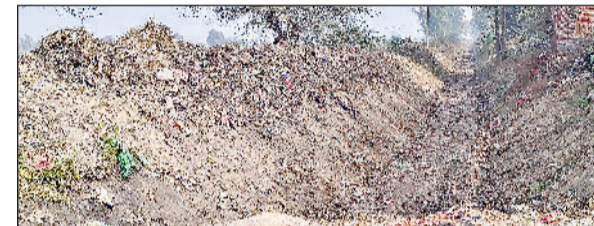
गन्नीर। बड़ी गांव के समीप राजपुरा माइजर से कबाड़ को निकाल कर पट्टी पर उला हुआ।