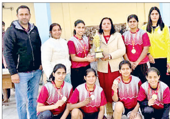
सोनीपत। विजेता छात्रों को पुरस्कृत करते हुए।

सोनीपत। सोनीपत में कोहरे के मौसम को ध्यान में रखते हुए थाना यातायात मुख्यालय प्रभारी निरीक्षक कर्मवीर और उनकी टीम ने बहालगढ़ चौक पर सड़क सुरक्षा और यातायात नियमों को लेकर जागरूकता अभियान चलाया।